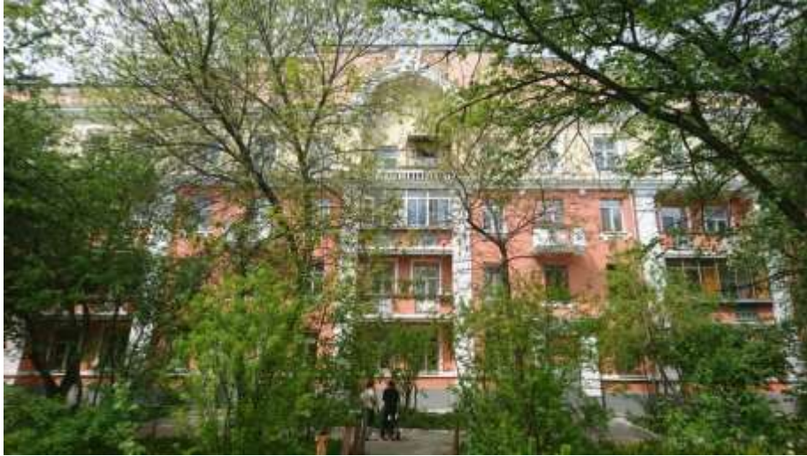
Дом информантки, ул. Красных Партизан, Дворянское Гнездо, Уралмаш. Фото сделано во время интервью, май, 2017 года