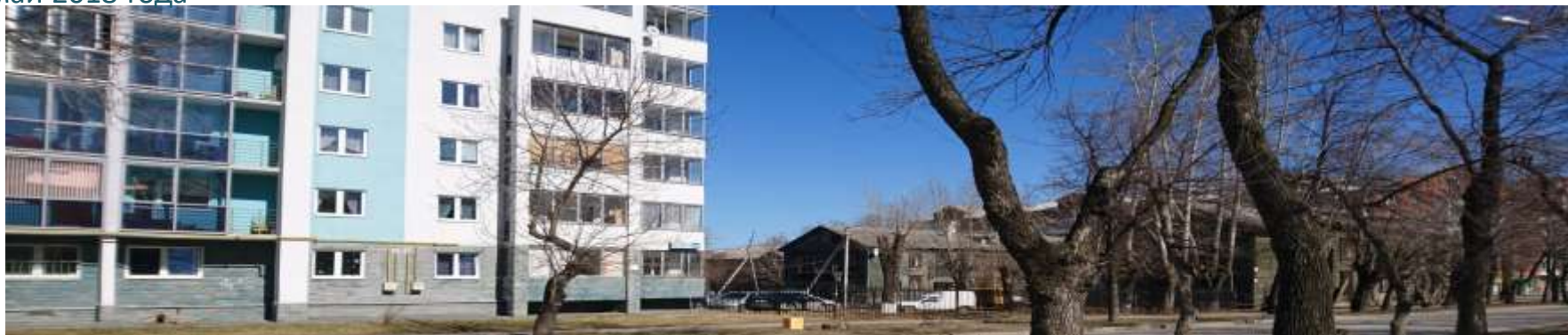
Соседство домов современной постройки (gated communities) и домов барачного типа, ул.Кировоградская, 50, г. Екатеринбург, май 2018 года