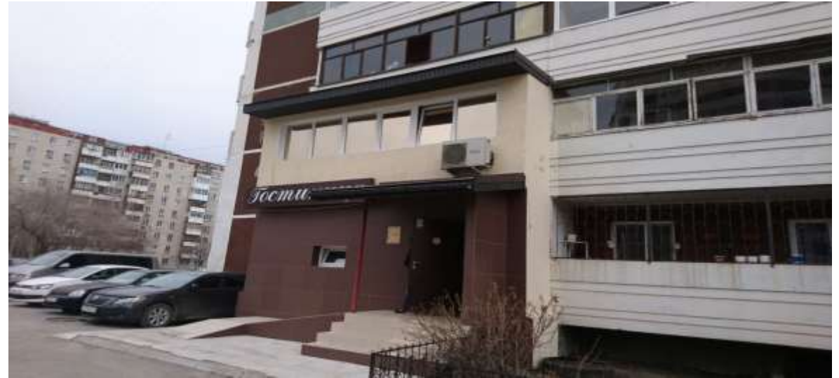
Мини-гостиница, ул. Уральских рабочих, 23, г. Екатеринбург, май 2018 года