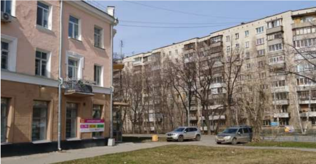
Перекресток улиц Кировоградской и Орджоникидзе, г. Екатеринбург, май 2018 года